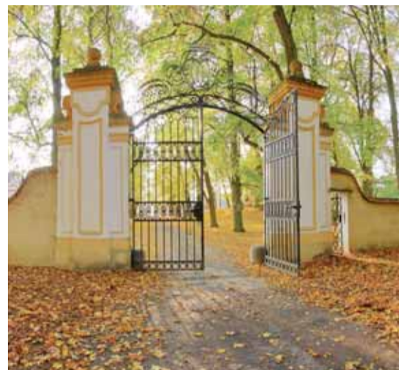
○ Brána do ratměřického zámeckého parku