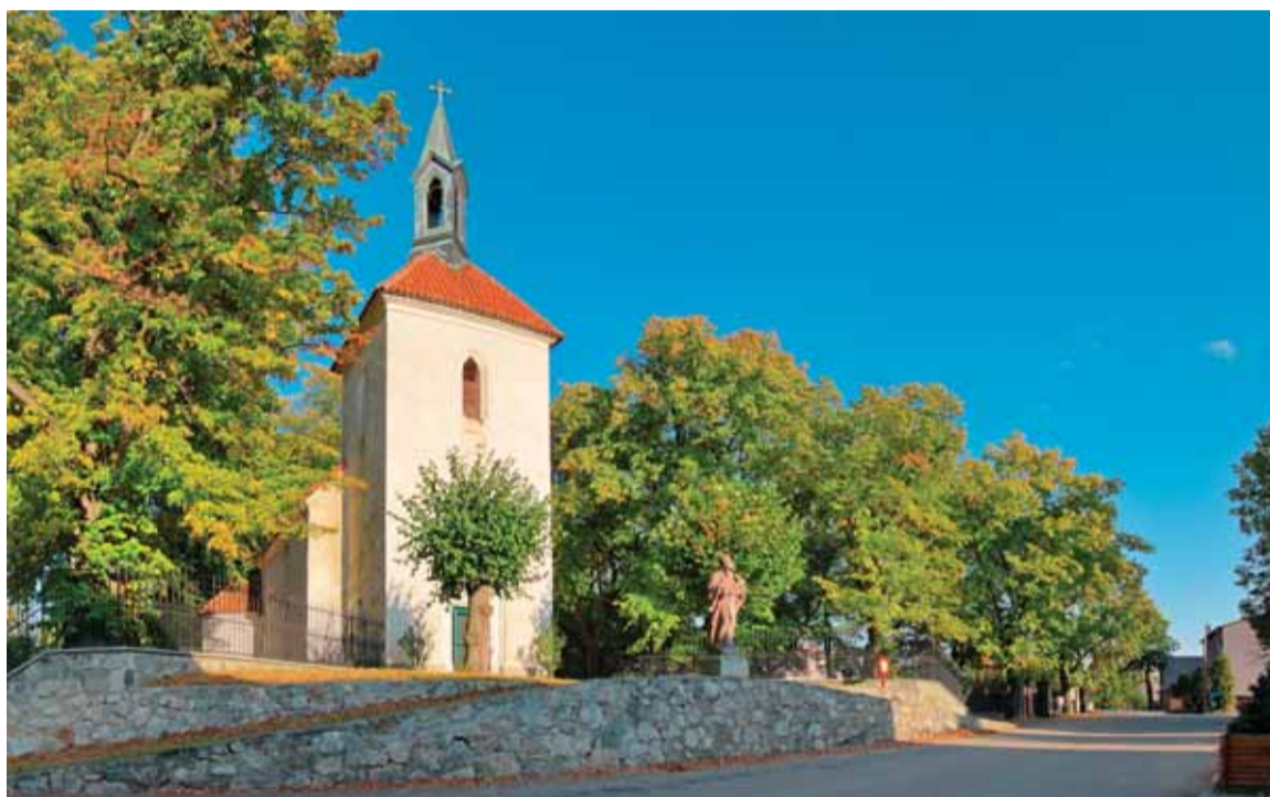
○ Kostel sv. Havla v Ratměřicích

Ratměřice – Pětiletou pauzu v soutěži Vesnice roku si musí dát