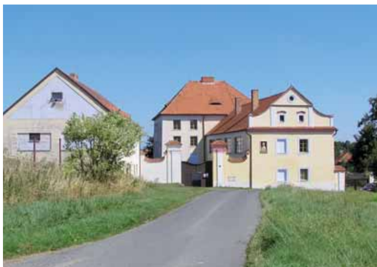
○ Zámek v Růžkových Lhoticích nedaleko Čechtíc

předán místnímu jednotnému zemědělskému družstvu. Poté je získalo Okresní muzeum v Benešově. Zámek byl zrekonstruován do podoby z dob pobytu Bedřicha Smetany a byla v něm otevřena hudební expozice. V zámku je umístěna pobočka vlašimského Muzea Podblanicka. Zdejší expozice nazvaná Hudební tradice Podblanicka se zabývá počátky Smetanovy tvorby, ale je zaměřena také na skladatele, kteří se v regionu narodili, jako Josef Suk, Jan Dismas Zelenka a Josef Dukát. Působili tu i Richard Wagner či Gustav Mahler. Pokud Růžkovy Lhotice navštívíte, určitě nebudete litovat, protože je zde vystaveno mnoho zajímavých exponátů, jako zasunovací piano, několik klavírů, na které Smetana hrál, partitury oper jeho i jeho kolegů, ale také návrhy scén a originály programů.