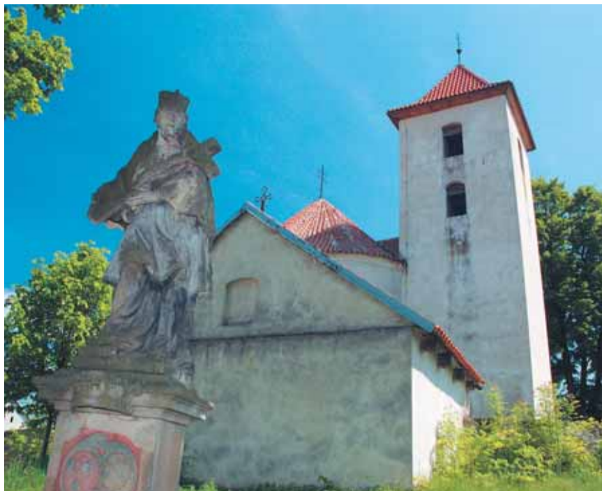
○ Románský kostel sv. Václava v Libouni

Na kondracké návsi stojí neobvyklý kostel se dvěma válcovými věžemi zasvěcený sv. Bartoloměji. Kostel je původně románský, z doby po roce 1200, později sice upravován a přestavován, dosud má ale na první pohled románské rysy. Věže jsou prolomeny dvěma řadami podvojných typicky románských oken. Mezi věžemi byla později postavena ještě jedna dřevěná věž pro zvon. V roce 1918 ale uhořel do této věže blesk, kostel vyhořel a dodnes jsou viditelné stopy po požáru v interiéru na pilířích. Při požáru se zřítil i zvon ze shořelé zvonice a při pádu prorazil dřevěný strop a dopadl na barokní klenbu i románské tribuny v přízemí. Po požáru už třetí dřevěná věž obnovena nebyla. Oltář a kazatelna kostela sv. Bartoloměje pocházejí ze zatopených Dolních Kralovic.