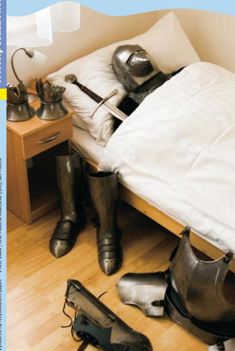
Vyrobeno na recyklovaném papíře – v roce 2008 | foto: Alžběta Rubešová (rytíř), Jan Hocek

Na projektu spolupracují města Vlašim a Trhový Štěpánov, městys Louňovice pod Blaníkem a obce Kamberk, Kondrac, Načeradec a Pravonín.