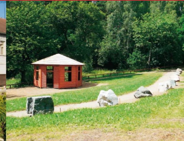
Geologická expozice hornin Podblanicka Český svaz ochránců přírody Vlašim

Expozice se nachází pod Velkým Bláníkem v blízkosti parkoviště nad obcí Kondrac. Návštěvníci se v ní mohou seznámit s geologickou minulostí Podblanicka a využitím přírodního bohatství (lom, doly). Naleznou zde rovněž 21 vzorků hornin z okolních lomů spolu s popisem jejich složení. Expozice je součástí naučné stezky S rytířem na Bláník, která vede přes vrchol Velkého Bláníku k Louňovicím pod Bláníkem.