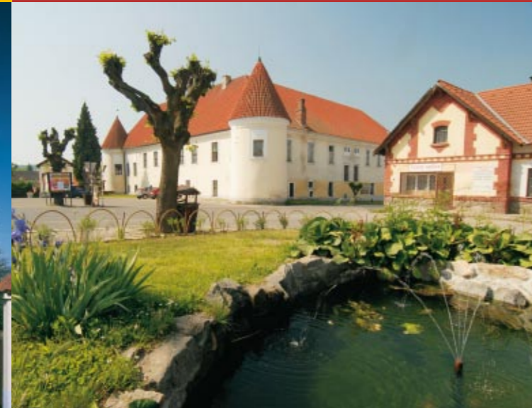
Muzeum Louňovice pod Bláníkem