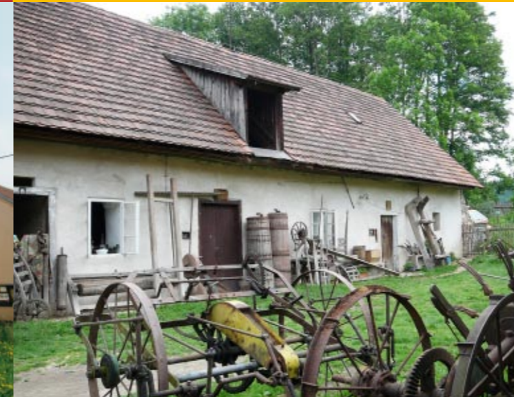
Domácí muzeum v Milovicích

Cílem aktivit tohoto muzea je zachránit a uchovat co nejvíce předmětů, které doprovázely každodenní život venkovských lidí. Vystavené předměty pocházejí především z Benešovska, ponejvíce pak z Milovic, Postupic a blízkého okolí. Je zde představena zařízení venkovská světnice s kuchyňským koutem a náčiním, nářadí a nástroje sloužící ke zpracování zemědělských produktů, dílna s nářadím různých řemesel, množství zemědělského nářadí a strojů i některé kuriozity. Většina předmětů dokumentuje život venkova první poloviny 20. století.