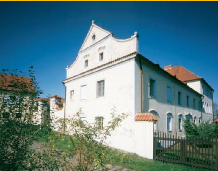
Růžkovy Lhotice Muzeum Podblanicka

Pobočka Muzea Podblanicka v Růžkových Lhoticích sídlí ve zdejší barokní zámku, který byl postaven na místě původní tvrze Oneše Tluksy ze Lhotic ze 14. století a dodnes tvoří dominantu malebné vsíky.