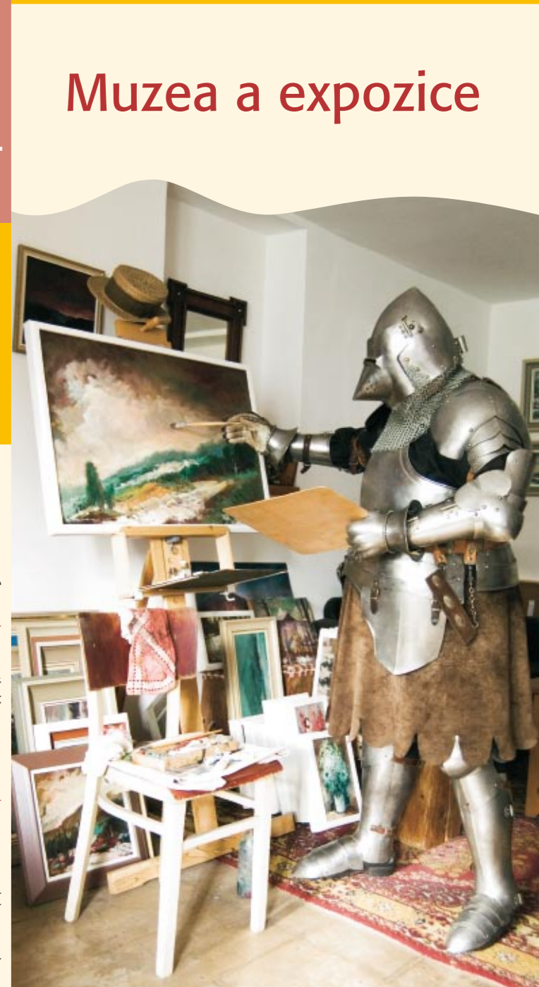
Vyrobeno na recyklovaném papíře – v roce 2008 | text: Mgr. Radovan Čáder a archiv

Na projektu spolupracují města Vlašim a Trhový Štěpánov, městy Louňovice pod Blaníkem a obce Kamberk, Kondrac, Načeradec a Pravonín.